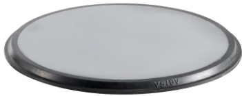
SC510-608EC SNR Blechdeckel Blechdeckel SC..EC, für Gehäuse